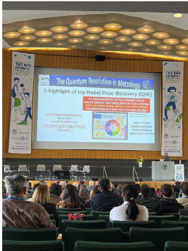
4 pav. Klaus von Klitzing pristatymas.