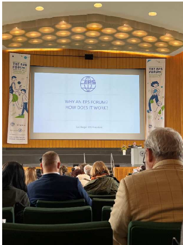
3 pav. Europos fizikų draugijos prezidento Luc Bergé „EPS forumo“ atidarymo kalba ir pranešimas.