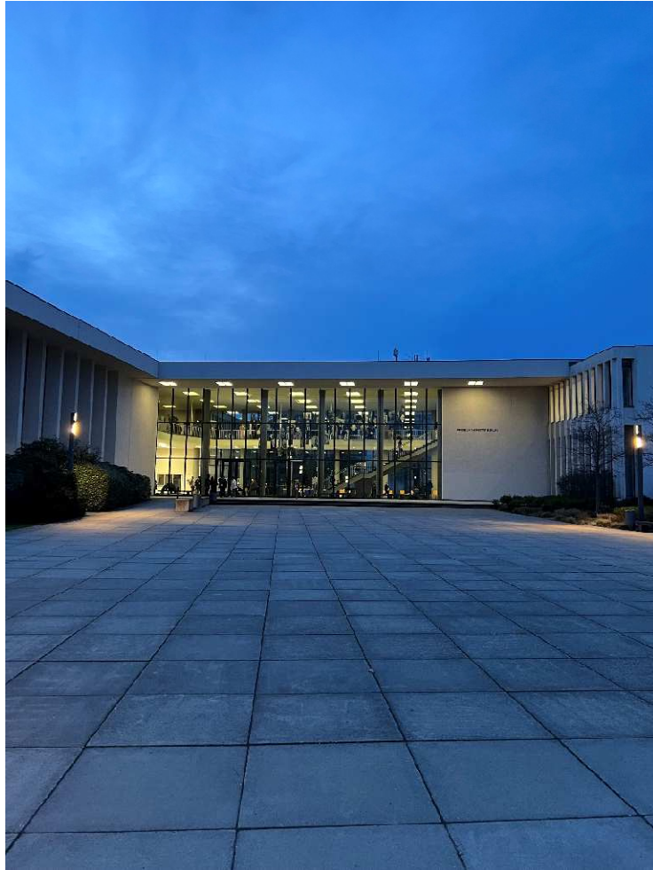
6 pav. Forumo pabaiga.