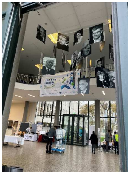
1 pav. Atvykimas į forumą.

Antroji diena prasidėjo aukštu tempu: jau nuo pačio ryto dalyvių laukė trys Nobelio premijos laureatų pristatymai fizikos ir chemijos srityse (Anne L'Huillier, Klaus von Klitzing ir Stefan Hell). Tuomet sekė gausus pristatymų pasirinkimas, leidęs tuo pat metu kiekvienam individualiai pasirinkti sau rūpimą temą ir išklausyti pasirinktą pranešimą, tačiau nemažai dalyvių visgi pasirinko „Applications of nuclear and particle physics“ pristatymą. Na, o vakaro kulminacijoje – tai pačių jaunųjų forumo dalyvių stendiniai pristatymai, kuriame savo rezultatus pristačiau ir aš. Galiausiai visiems pristačius savo darbus, buvo paskelbta forumo pabaiga, po kurios teko grįžti į hostelį krauti mantos namo.